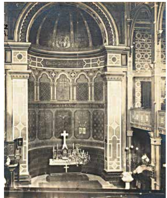
Po prawej: wnętrze nieistniejącego kościoła ewangelickiego pw. Św. Piotra u zbiegu ulic Kryświewicza i Półwiejskiej w Poznaniu