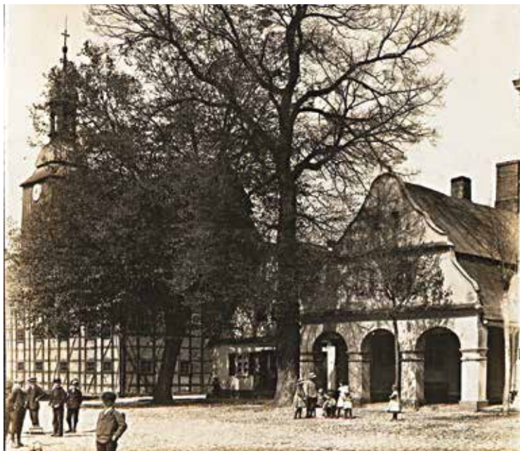
Po lewej: Rynek w Rakoniewicach na pocz. XX w.

Materiał ikonograficzny wybrany do digitalizacji można przeglądać za pośrednictwem strony internetowej Biblioteki PTPN (zakładka Cyfrowe kolekcje ikonograficzne).